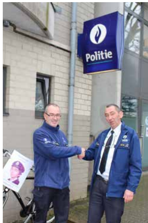
wissel van de (politie)macht in Kasterlee.

Met de gemeentelijke technische dienst en milieudienst werden afspraken gemaakt om kleine sluikstorten (o.a. misbruik bladerkorven) sneller af te handelen. Er werd één GAS-pv opgesteld.